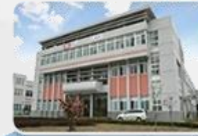
MEAN WELL SUZHOU 2006