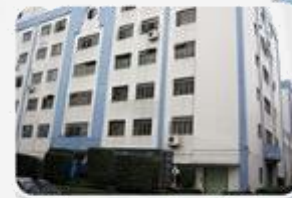
MEAN WELL GUANGZHOU 1993