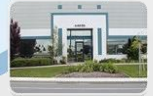
MEAN WELL USA, INC. 1999