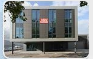
MEAN WELL EUROPE B.V. 2006