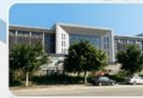
MEAN WELL GUANGZHOU (Huadu) 2016