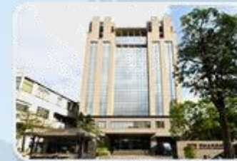
MEAN WELL TAIWAN (HEAD OFFICE) 1982